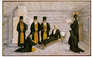
Οἱ τελευταῖς στιγμὲς τοῦ Ὁσίου Τρύφωνος. Λιθογραφία 1888. Ἀρχαγγέλσκ.

Ὁ Ὅσιος Τρύφων παρέδωσε τὴν ψυχὴ του στὸν Κύριο τὴν 15η Δεκεμβρίου 1583, ἀφοῦ προηγουμένως προεἶδε τὴν ἡμέρα τῆς ἐκδημίας του καὶ τὴν ἐπικείμενη καταστροφὴ τῆς Μονῆς ἀπὸ τοὺς Σουηδοὺς, ἡ ὁποία ἔλαβε χώρα τὸ 1590. Σ φαγιάσθηκαν τότε ὅλοι οἱ Μοναχοί, καὶ πρῶτο θῦμα ὑπῆρξε ὁ Στάρετς Ἰωνᾶς, ὁ ὁποῖος ἀργότερα ἐπετέλεσε πολλὰ θαύματα γιὰ τοὺς Μοναχοὺς τῆς ἀνακαινισμένης πλέον Μονῆς.