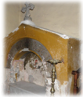
Ὁ Τάφος τοῦ Ὁσιομάρτυρος Κοσμά.

Όταν ἔφθασαν στὶς Καρυές , τὴν πρωτεύουσα τοῦ Ἁγίου Ὁρους, ἡ ὁποία ἐλειτουροῦσε τότε ὡς Λαύρα 2 , οἱ στρατιῶτες τοῦ Αὐτοκράτορος συνέλαβαν τὸν Πρῶτο τοῦ Ἁγίου Ὁρους, τὸν Ὅσιο Κοσμά, τοῦ ὁποίου ἡ ἀνένδοτος στάσις εἶχε ἐνθαρρύνει πολλοὺς Μοναχοὺς, καὶ ἀπεκεφάλισαν αὐτὸν μαζί με ἄλλους Ἀσκητὰς, οἱ ὁποῖοι εὐρίσκοντο ἐκεῖ. Κατόπιν οἱ στρατιῶτες ἐπυρπόλησαν τὴν Ἐκκλησία, τὰ μοναστηριακὰ κτήρια καὶ Κελλῖα, ἀφοῦ προηγουμένως τὰ ἐλεηλάτησαν με μανία, καὶ ἄφησαν ὀπίσω τους καπνίζοντα ἐρείπια, γιὰ τὴν ἀνοικοδόμησι τῶν ὁποίων ἐχρειάσθησαν χρόνια.