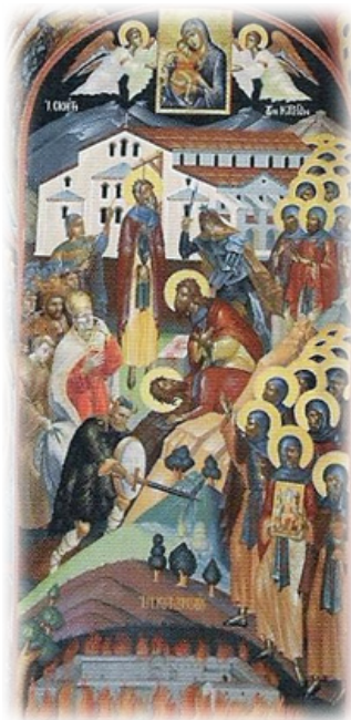
Τὸ Μαρτύριο τῶν Καρεωτῶν Όσιομαρτύρων. Τοιχογραφία Τραπεζῆς Ἱεράς Μονῆς Κουτλουμουσίου.

ἔστειλαν ἀπεσταλμένους στὴν Βασιλεύουσα. Ὁ Αὐτοκράτωρ ὅμως τοὺς ἐπεφύλαξε μόνο διωγμοὺς καὶ διώξεις.