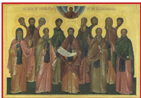
Οί 13 Όσιομάρτυρες τῆς Ἱεράς Μονῆς Βατοπαιδίου.