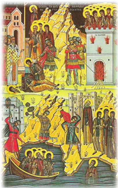
Οἱ Ἅγιοι Ἀγιορείται Όσιομάρτυρες ἐπὶ Πατριάρχου Βέκκου τοῦ Λατινόφρονος μαρτυρήσαντες.

Στὴν Μονὴ Βατοπαιδίου ἀπηγόνισαν δώδεκα Μοναχοὺς στὴν κορυφῆ ἑνὸς γειτονικοῦ λόφου